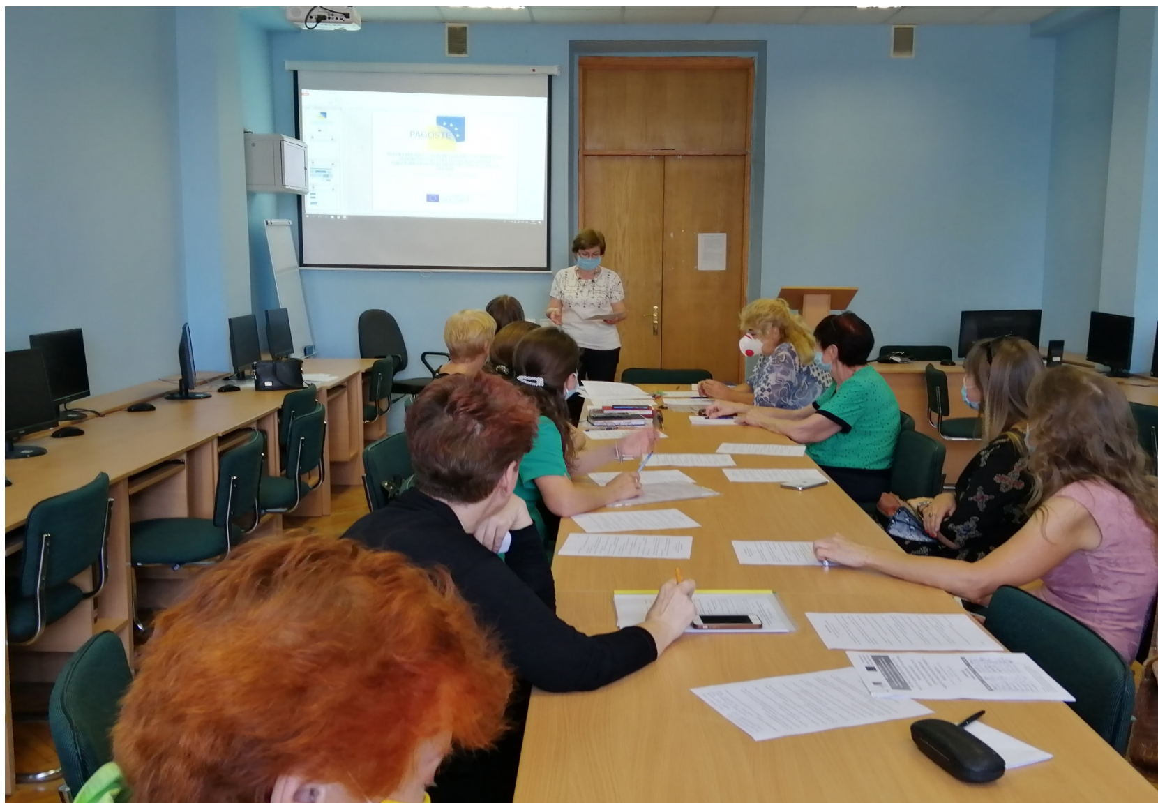
Meeting of Academic Council of the Faculty of Economics and Law of the National Transport University (25.06.2020)