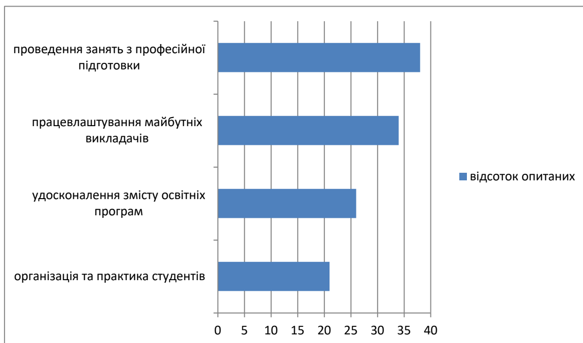
Рисунок 1. Напрямки розвитку співпраці університету з закладами професійно-технічної освіти, у % респондентів

Тому слід проводити відповідну роботу з метою розширення обізнаності студентів у данній галузі. У той же час студенти високо оцінили співпрацю університету з професійно-технічними навчальними закладами: 72 % студентів обрали варіанти "дуже хороший" та "досить хороший". Були також запропоновані напрямки подальшої співпраці (див. рис. 2).