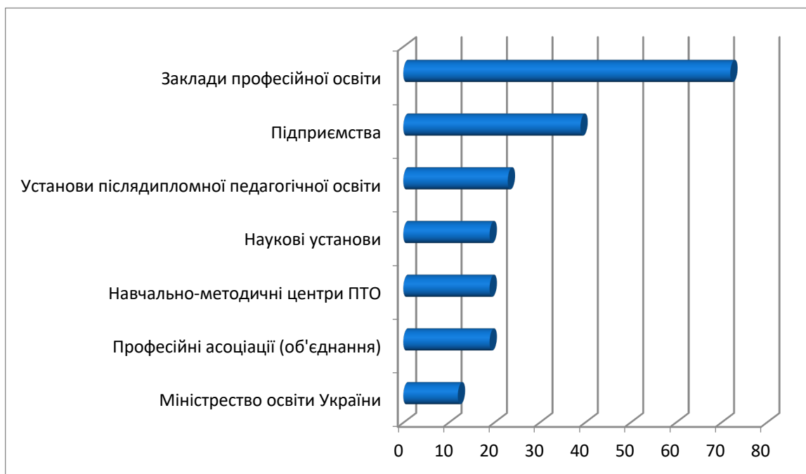
Рисунок 3. Партнери, з якими співпрацюють викладачі ВНЗ, у% респондентів

Всі респонденти (100 %) позитивно оцінили співпрацю університету з закладами професійної освіти. Результати оцінювання респондентами різних напрямків такої співпраці, представлені в таблиці 5, показали, що загалом позитивно оцінили співпрацю з ПТО щодо працевлаштування майбутніх педагогів лише 76 % опитаних. У той же час, опитувані викладачі вищих навчальних закладів високо оцінили необхідність розвитку співпраці між університетом та закладами професійної освіти у всіх сферах. Щодо обґрунтованості залучення до практичних занять викладачів ПТО, більшість опитаних (95%) відповіли позитивно, також щодо доцільності залучення викладачів ЗВО до проведення занять у професійно-технічних навчальних закладах. Викладачі вищих навчальних закладів також одногolosно заявили, що відчувають потребу в постійному розвитку своїх професійних та педагогічних компетенцій.